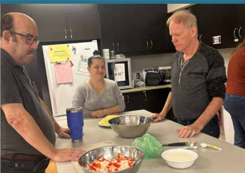
Cuisine collective automnale