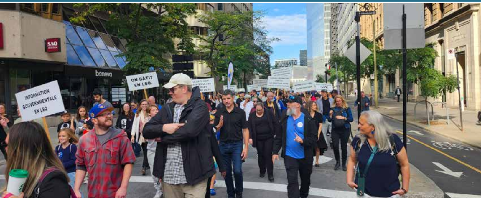
Journée mondiale des Sourds