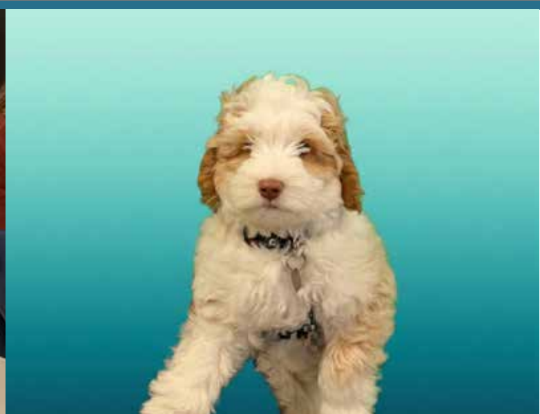
Bienvenue à Whisky