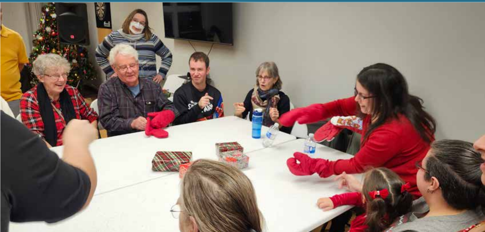
Fête de Noël