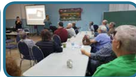
Vendredi 6 octobre, Déjeuner solidaire, salle ANO