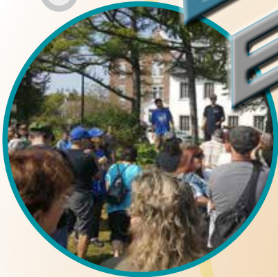
Journée mondiale des Sourds à Trois-Rivières