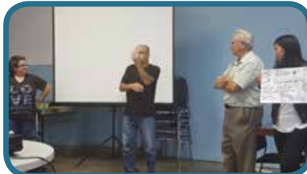
Jeudi 7 septembre, Déjeuner solidaire, salle ANO