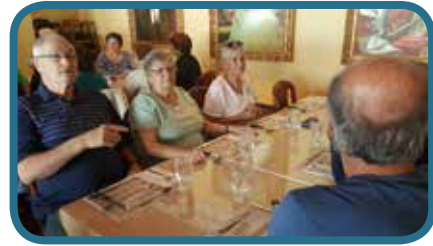
Lundi 2 octobre, journée nationale des aînés au buffet des continents à Gatineau