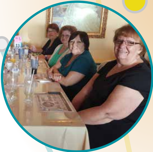
Journée nationale des personnes âgées